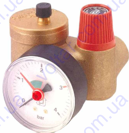
KSG 30 N