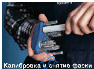
Калибровка и снятие фаски

Трубу отрезают под углом 90° при помощи ножниц для резки труб