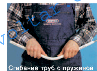
Сгибание труб с пружиной

Многослойные трубы PE-X/Al/PE-RT могут быть согнуты вручную или при помощи пружины.