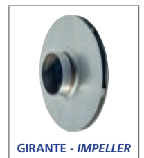
GIRANTE - IMPELLER