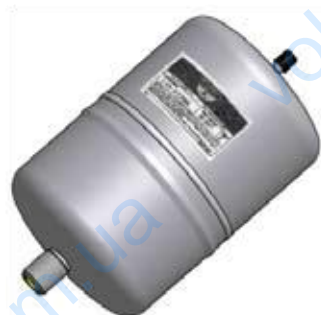
Disegno / Drawing 20016