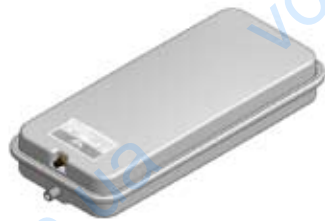
Disegno / Drawing 518