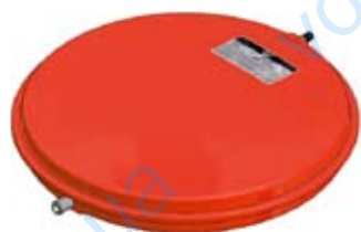
Disegno / Drawing 522/L