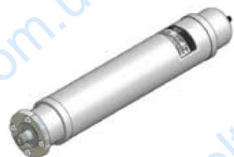
Disegno / Drawing 564/F