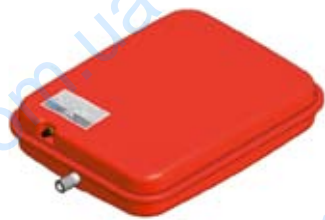
Disegno / Drawing P637/L