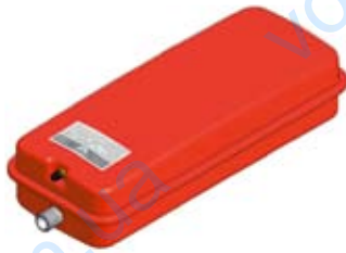
Disegno / Drawing 537/L