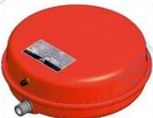
Disegno / Drawing 541/L