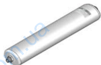
Disegno / Drawing 564