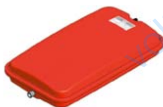
Disegno / Drawing 539/L