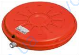
Disegno / Drawing 531/L