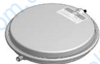
Disegno / Drawing 533