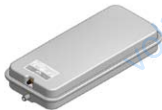
Disegno / Drawing 539/XL