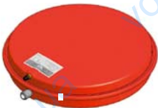
Disegno / Drawing 521/L