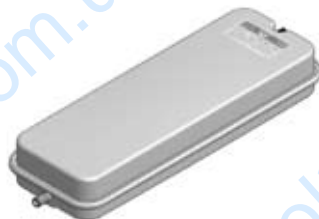
Disegno / Drawing 537/XL