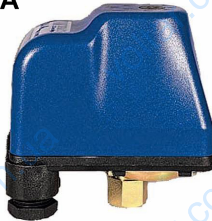
Реле давления РА 5 MI